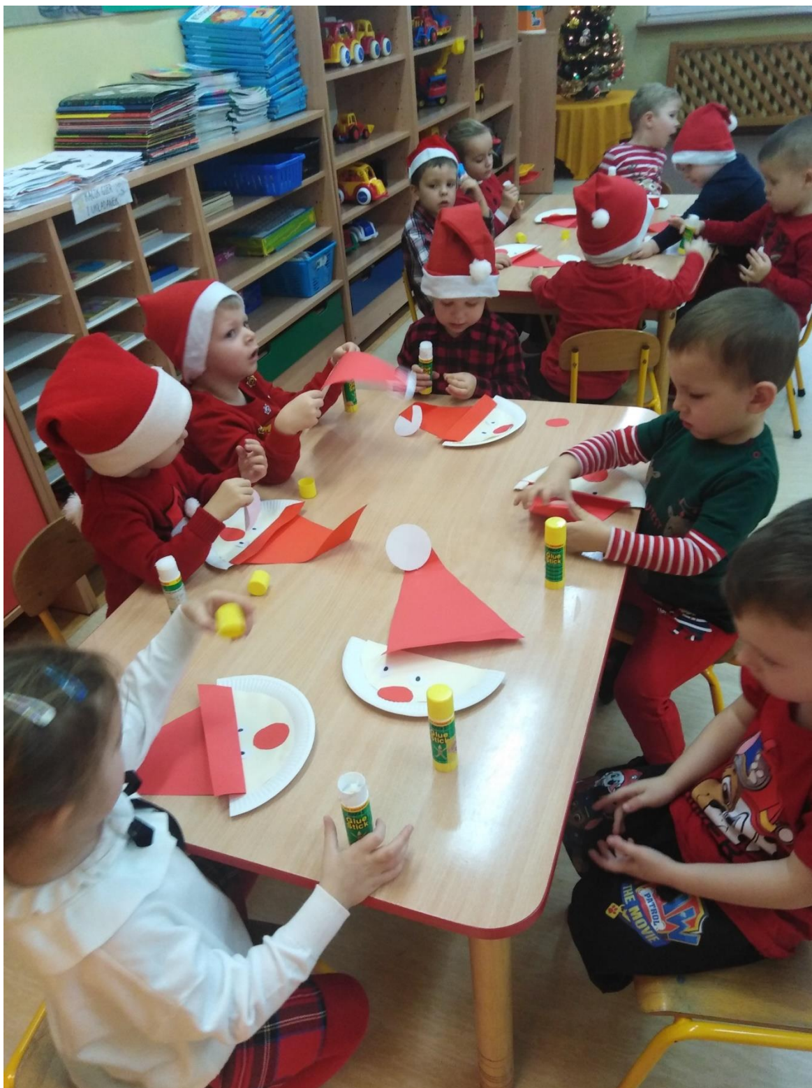
Wychowawczynie grup przedszkolnych i dzieci sześciolletnich