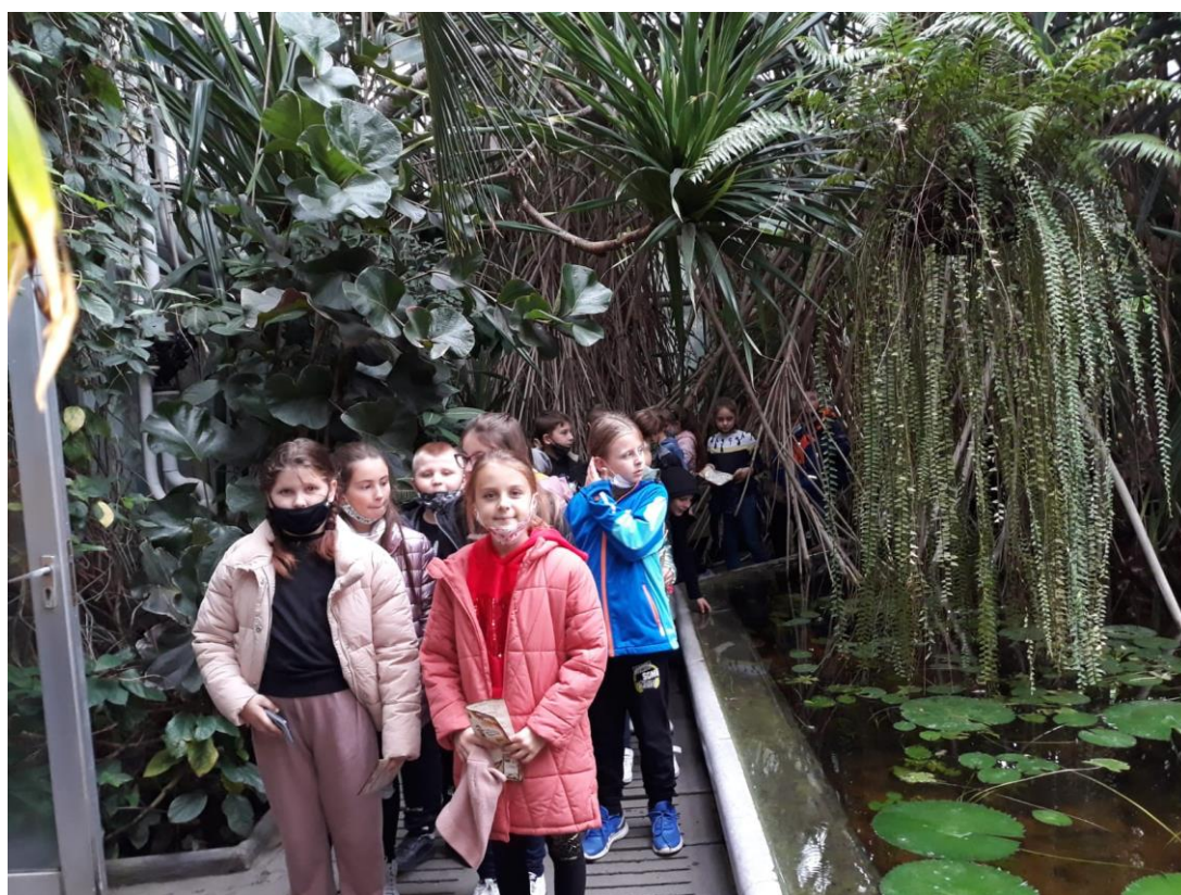
Wychowawczynie klas 1-3