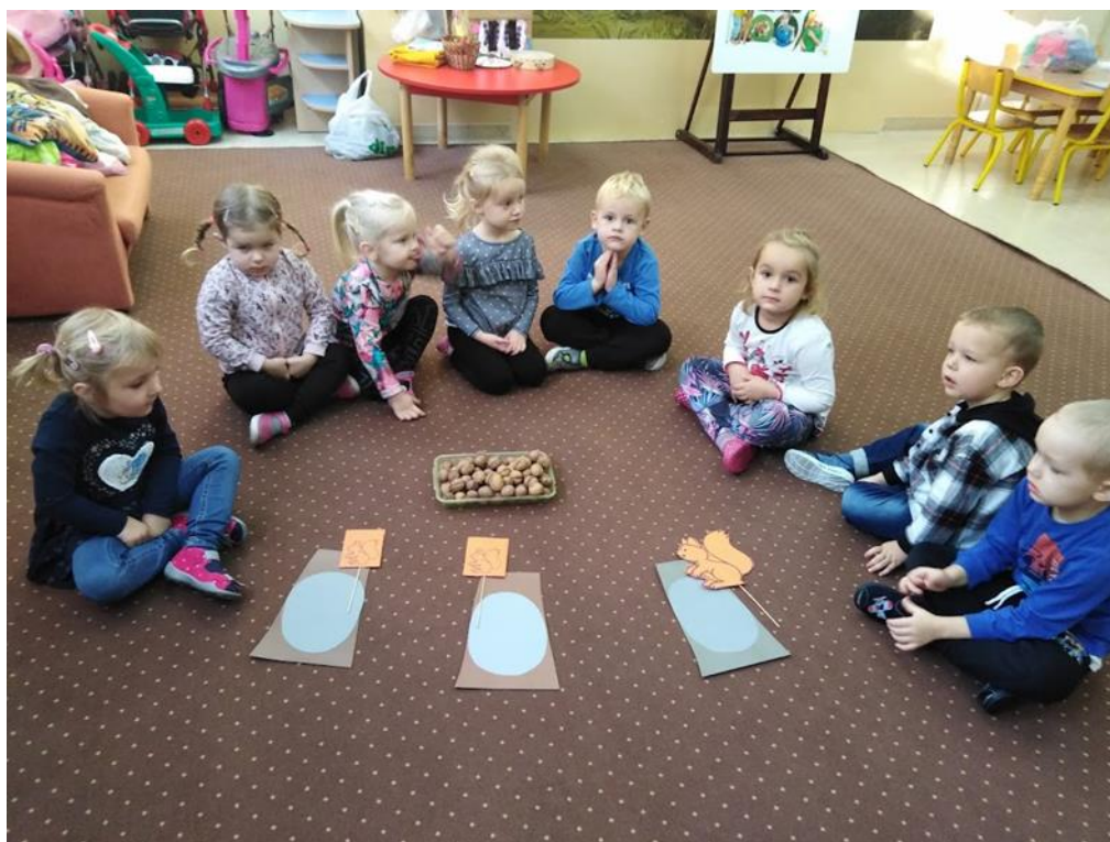
Wychowawczynie grup przedszkolnych

Nikt nie będzie polemizował z faktem, że pierwsze dni w przedszkolu są dla dziecka nie lada wyzwaniem. Dziecko dla którego do tej pory naturalnym środowiskiem była rodzina, zaczyna funkcjonować w nowym, nieznanym dotąd miejscu, które stawia przed nim nowe zadania, takie jak np. orientacja w nowej przestrzeni (organizacja przedszkola, sali, zabawek), konieczność kontaktu z obcymi osobami, modyfikacja dotychczasowego rytmu dnia, czy też rozwijanie przynależności grupowej. Pierwsze dni dla niektórych dzieci z grupy Pszczółek upłynęły pod znakiem płaczu i niechęci wobec nowego miejsca. Jednak z czasem okazuje się, że to przejściowe smutki. W grupie Pszczółek już od pierwszych dni słychać było muzykę oraz towarzyszące jej zabawy takie jak: „Baloniku nasz malutki”, „Kółko graniaste czy też „Stary niedźwiedź mocno śpi”. Podjęliśmy pierwsze próby wiązania koła i tworzenia par. Równie ochoczo dzieci tańczyły do piosenki z kolorowymi rekwizytami: piłkami, krążkami czy też szarfami. Udało nam się też wykonać prace plastyczne. W ramach realizacji zajęć o bezpieczeństwie na drodze wykonaliśmy sygnalizator świetlny. Jednak najbardziej upragnionym momentem dnia była świetna zabawa na placu zabaw, gdzie mogliśmy czerpać ostatnie promyki letniego słońca.