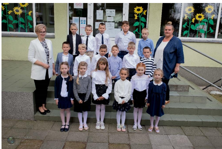
Wychowawczynie klas pierwszych