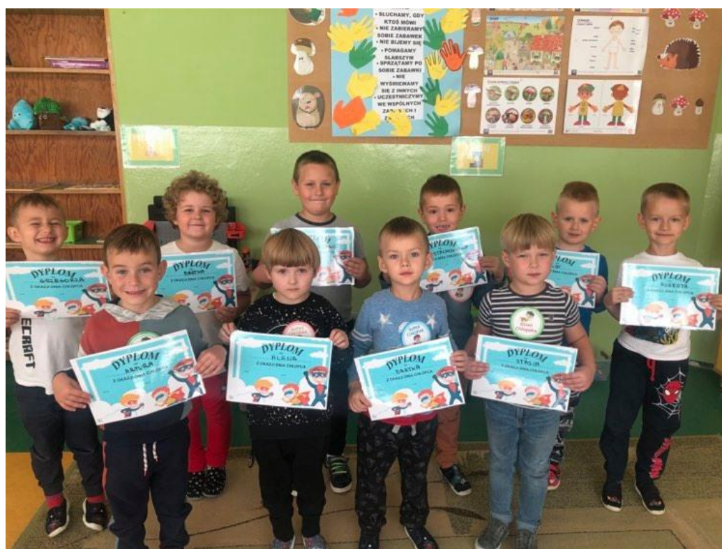
Wychowawczynie grup przedszkolnych i dzieci sześciolletnich