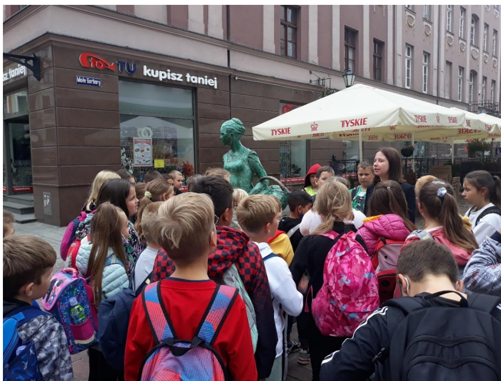
Wychowawczynie klas trzecich