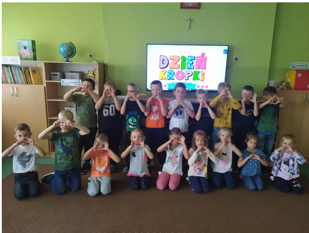
Wychowawczynie grup dzieci sześcioletnich