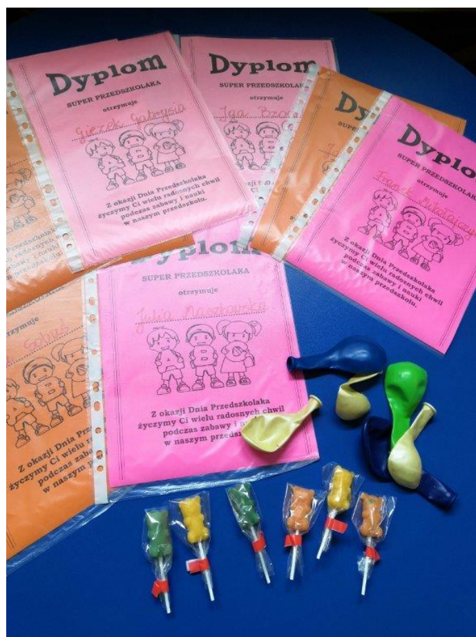
Wychowawczynie grup przedszkolnych