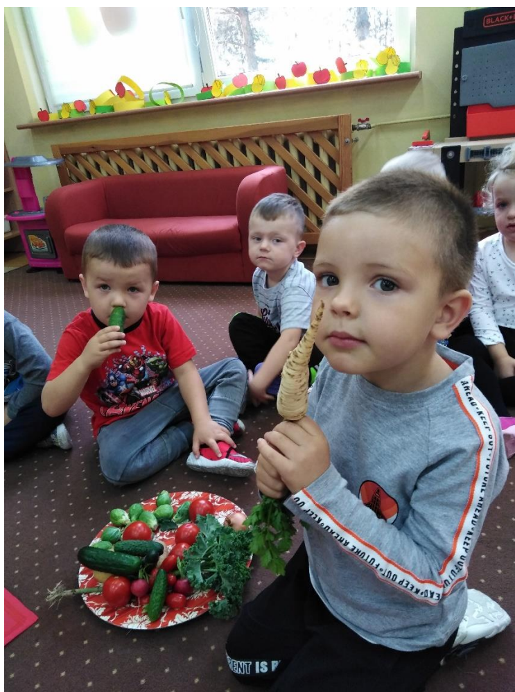
Wychowawczynie grup przedszkolnych