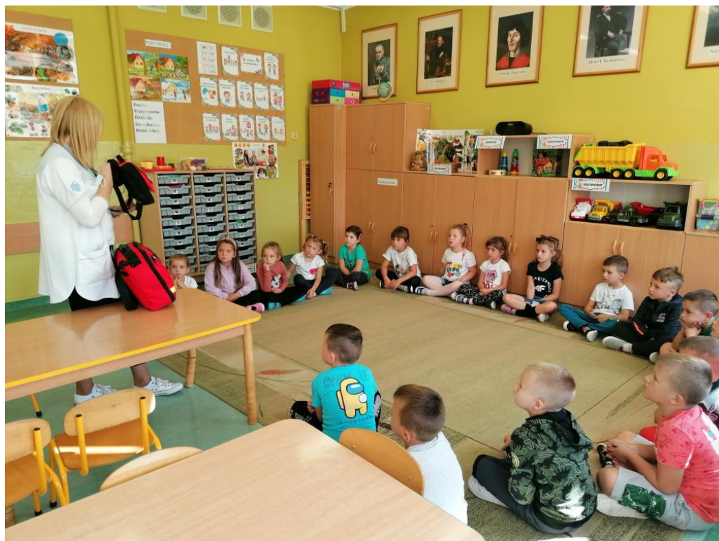
Wychowawczynie grup dzieci sześcioletnich