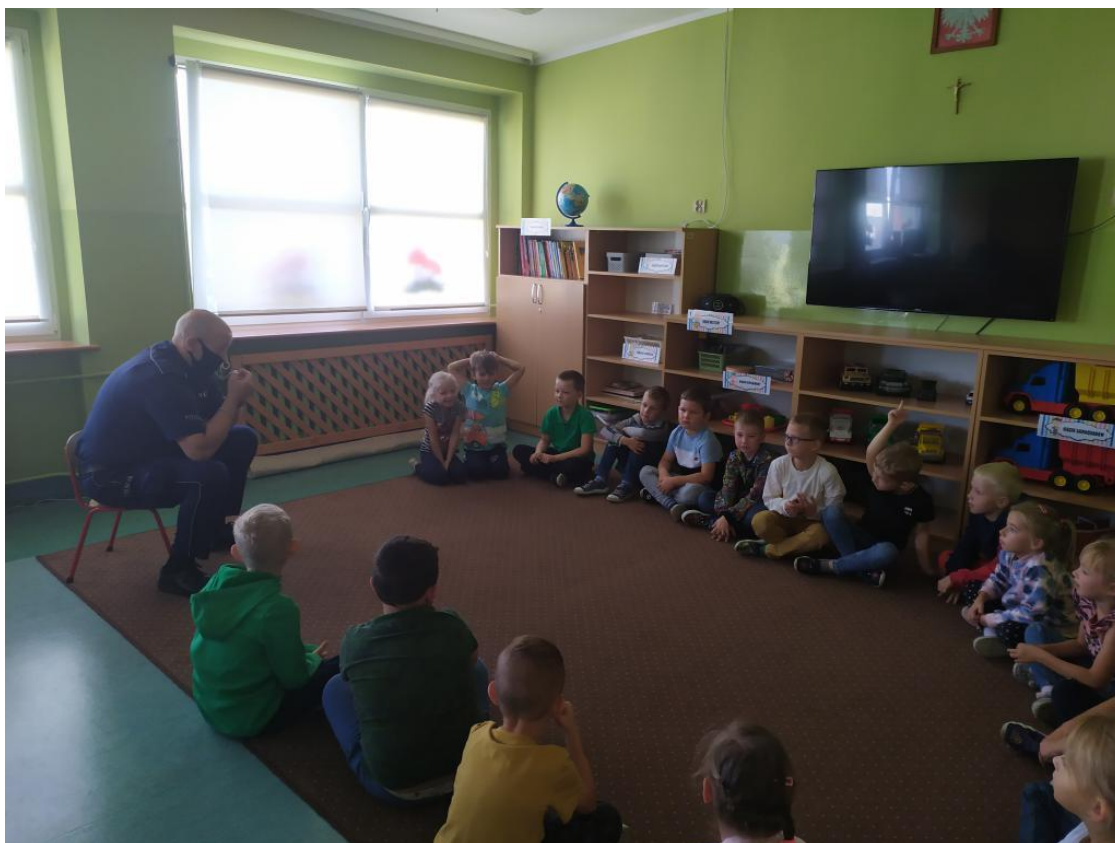
Wychowawczynie grup przedszkolnych i dzieci sześcioletnich