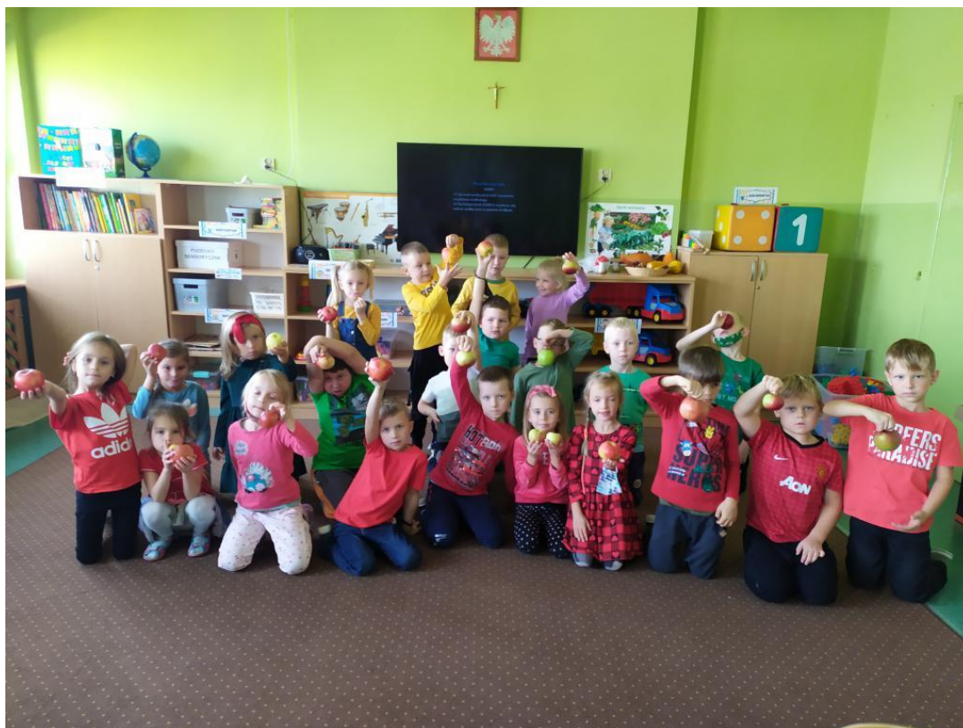
Wychowawczynie grup dzieci sześcioletnich