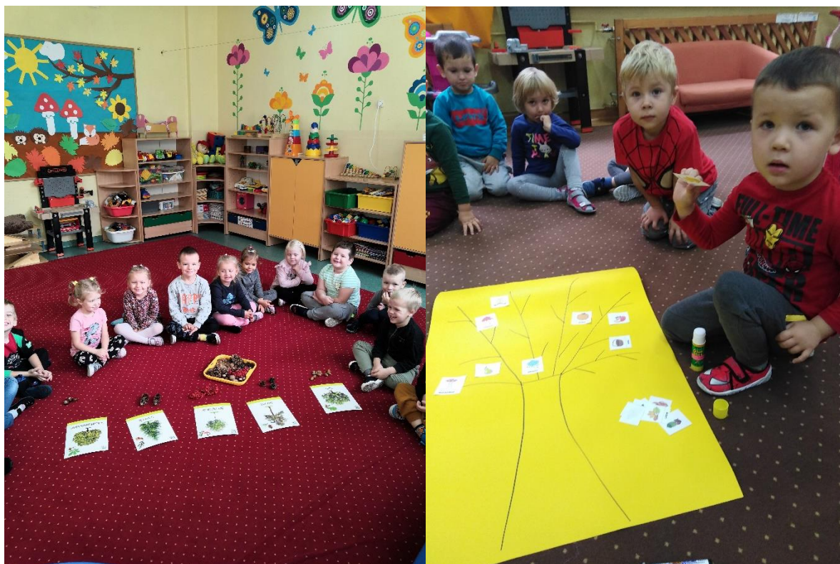
Wychowawczynie grup przedszkolnych