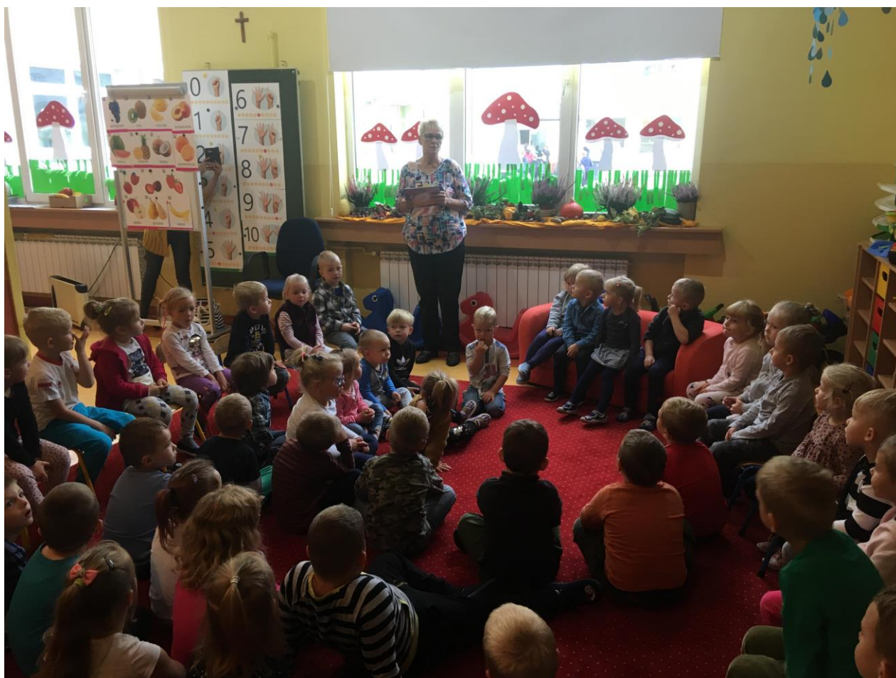
Wychowawczynie grup przedszkolnych

29 września obchodzimy Ogólnopolski Dzień Głośnego Czytania. Został on ustanowiony w 2001 roku przez Polską Izbę Książki. Z tej okazji 25 września 2019r. Gminna Biblioteka Publiczna w Pępowie zorganizowała akcję głośnego czytania przedszkolakom. Bardzo dziękujemy pracownikom Gminnej Biblioteki Publicznej za wizytę i przeczytanie bajek.