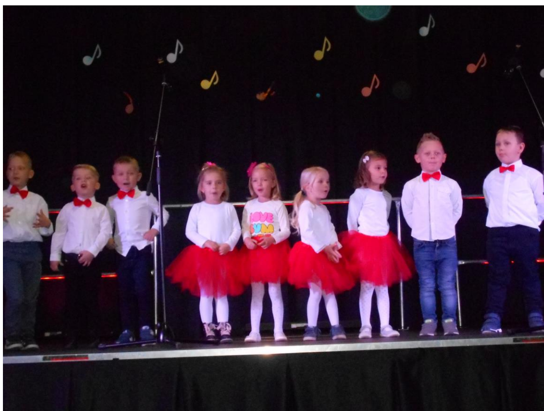
Wychowawczynie grup przedszkolnych