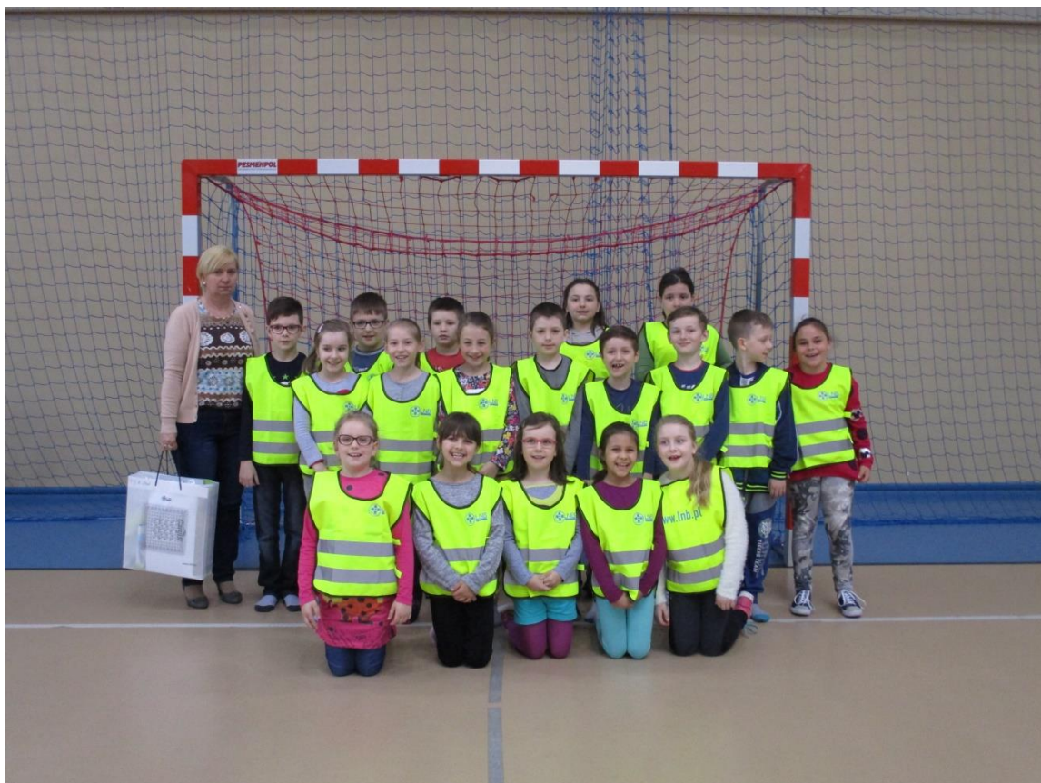
Wychowawczynie klas I-III