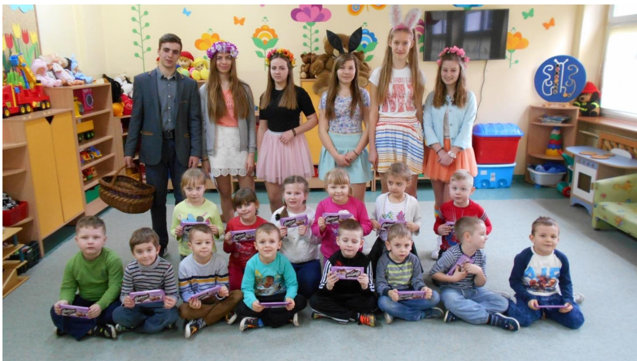
Wychowawczynie grup przedszkolnych