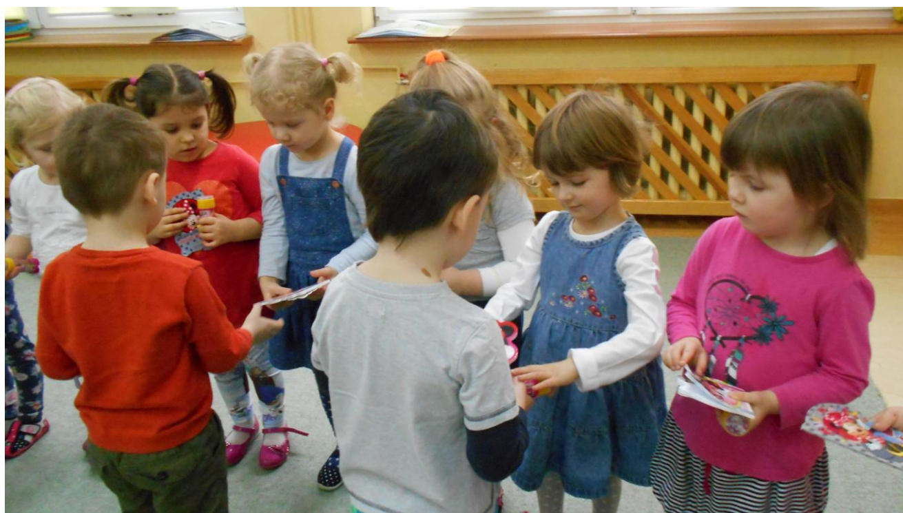
Wychowawczynie grup przedszkolnych