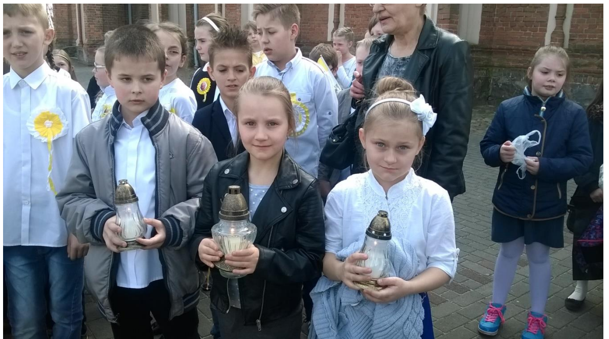
Wychowawczynie klas I-III