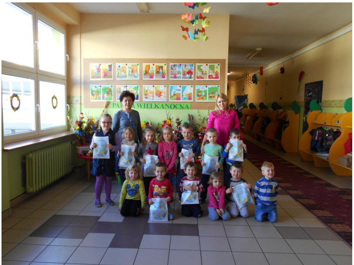
Wychowawczynie grup przedszkolnych