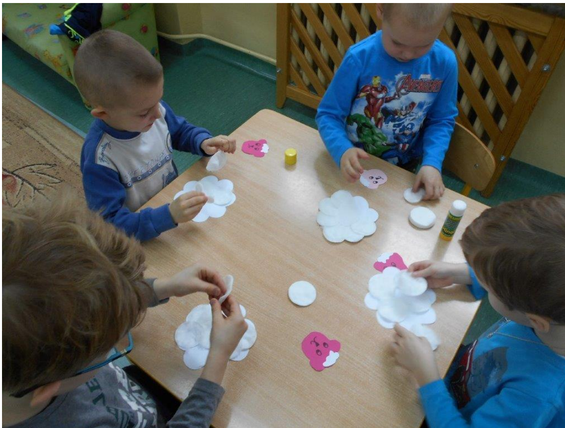
Wychowawczynie grup przedszkolnych