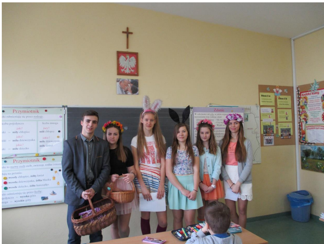
“Zajaczk” ze słodkościami od Rady Rodziców ☺

Tradycyjnie już, tuż przed wielkanocą uczniów klas edukacji wczesnoszkolnej odwiedza zajaczek, aby obdarować ich słodkościami. Nie inaczej było również i tego roku. Zajaczek wraz z uroczymi pomocnikami odwiedził wszystkie klasy w naszej szkole. Oprócz życzeń świątecznych, podarował każdemu uczniowi czekoladę od Rady Rodziców. W młodszych klasach pojawił się drugi zajaczek, który tym razem zostawił słodkie niespodzianki w koszykach, wywołując tym ogromną radość wśród dzieci.