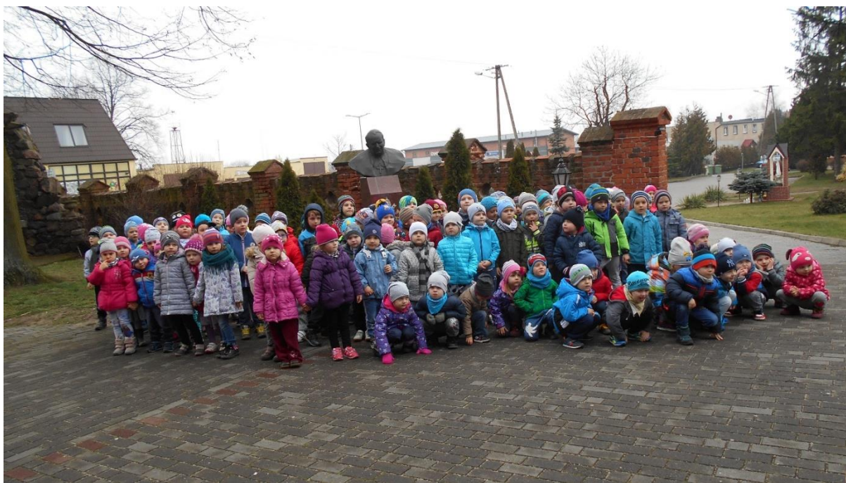
Wychowawczynie grup przedszkolnych