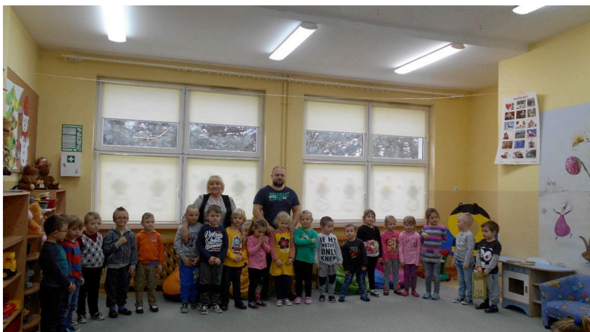
Wesołe Żabki po występie