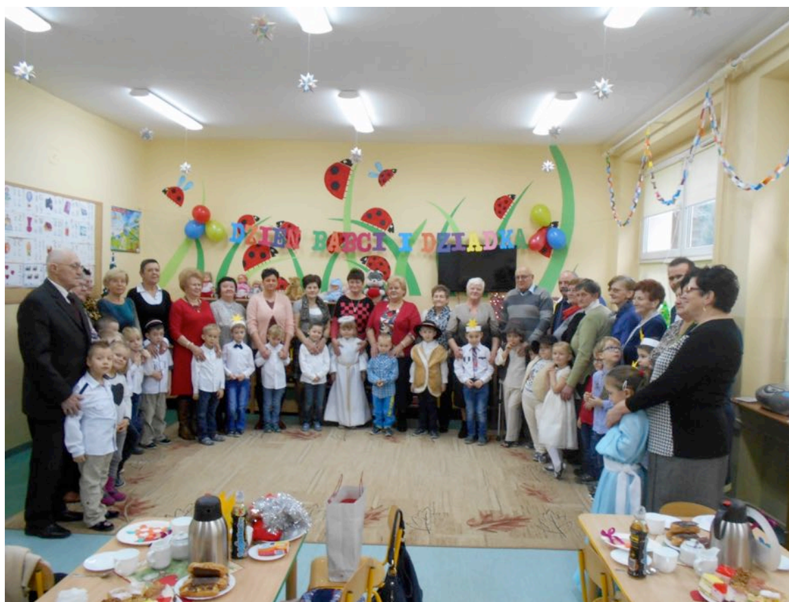
Dzień Babci i Dziadka w Biedronkach