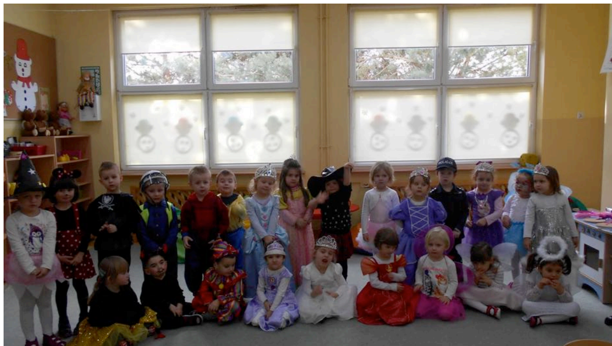
Karnawałowo w grupie Pszczółek