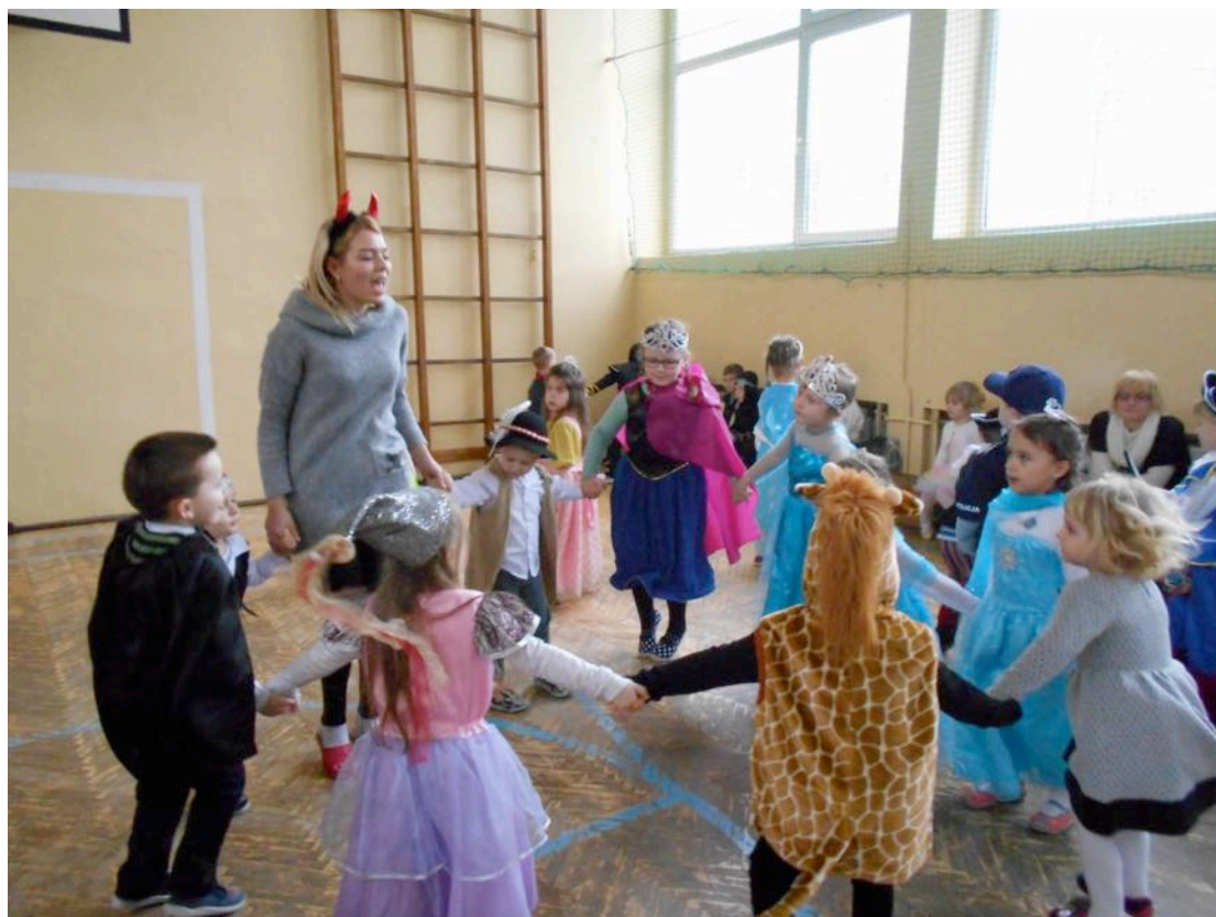
Bawiące się Ślimaczki