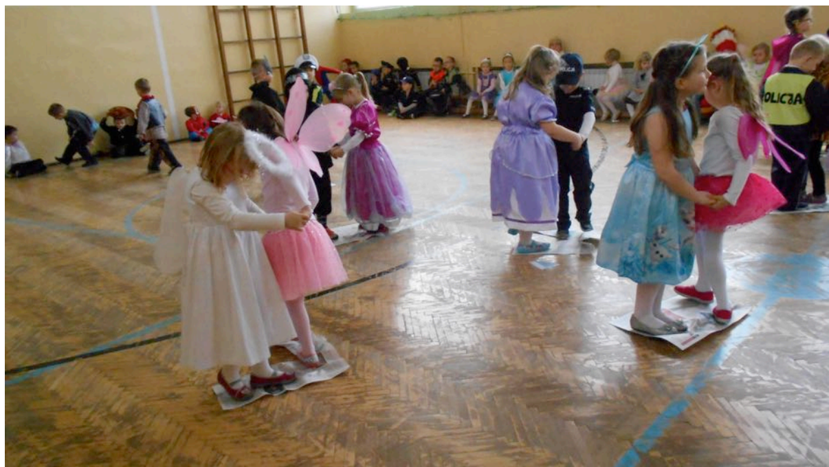
Roztańczone na gazetach Motylki