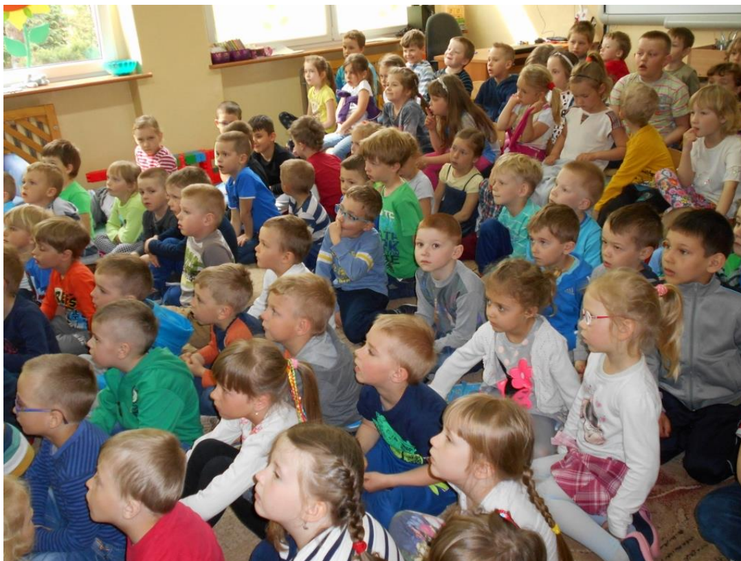
Wychowawczynie grup przedszkolnych