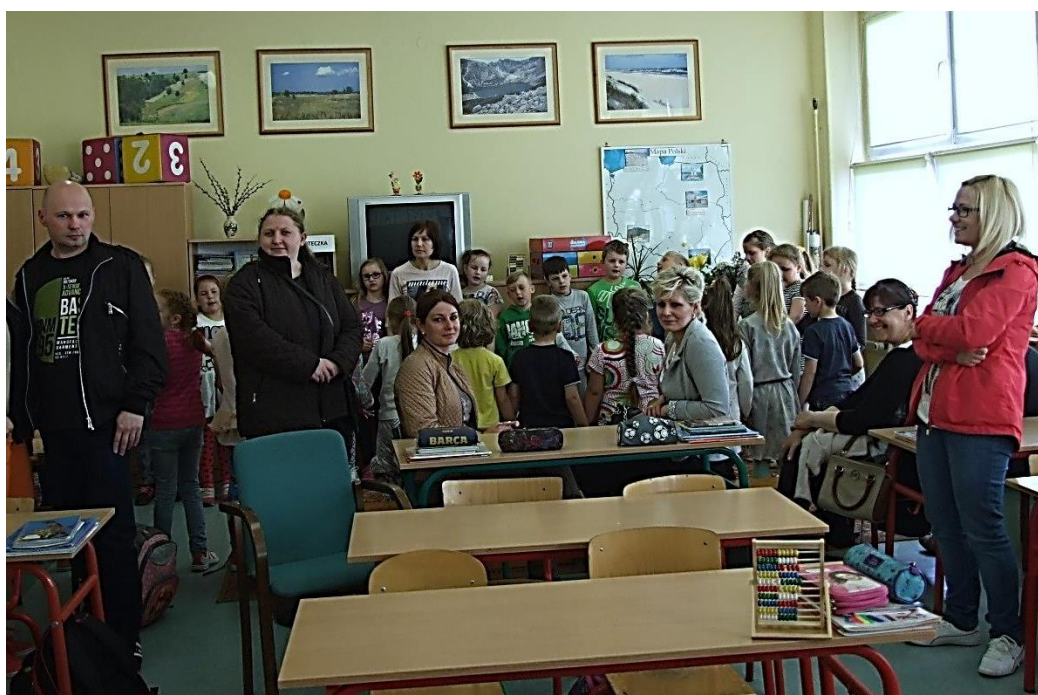
Wychowawczynie klas pierwszych