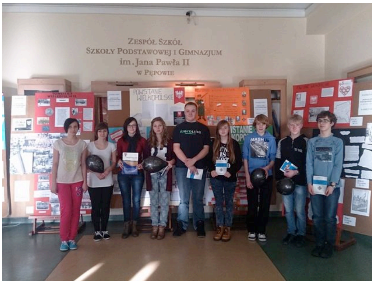
Laureaci konkursu historycznego o Powstaniu Wielkopolskim