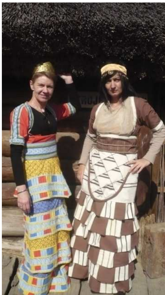
Trzeba przyznać, że Greczynki wyróżniały się strojem.