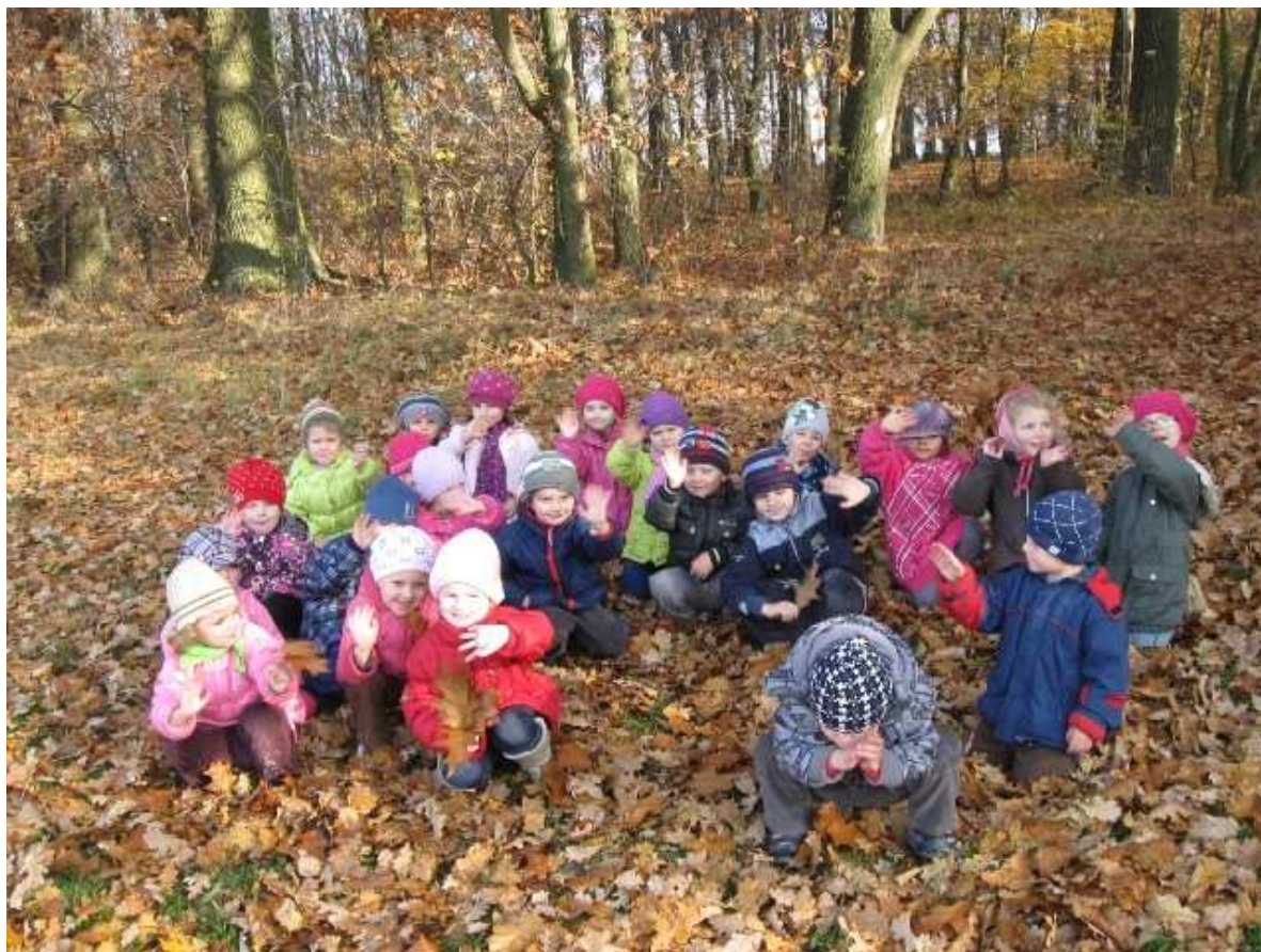
Motyłki w lesie.