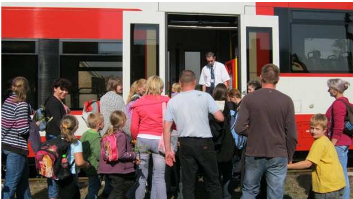
Uczniowie z pewnością na długo zapamiętają ten wyjazd.