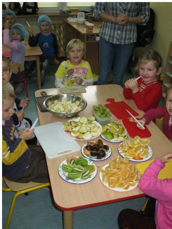
Nasze owocki w całości.