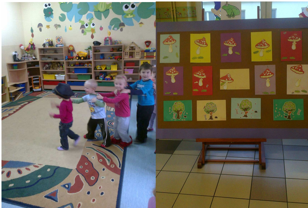
Wspólna zabawa w sali.

W tym roku szkolnym do grupy Żabek trafiły dzieci w wieku 3 – 4 lat, które po raz pierwszy zaczęły uczęszczać do przedszkola. Pierwszy miesiąc w grupie upłynął pod znakiem akceptacji nowych warunków, poznania obiektu przedszkolnego oraz nowych pań. Dzieci uczyły się bycia razem w jednej gromadzie, zachowania tolerancji oraz wzajemnego szacunku.