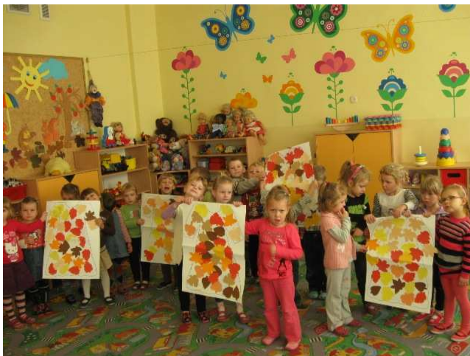
Sukienki dla Pani Jesieni.

Nasze zajęcia są bardzo ciekawe: wymyśliśmy sukienki dla Pani Jesieni albo malujemy pochmurny, mglisty poranek.