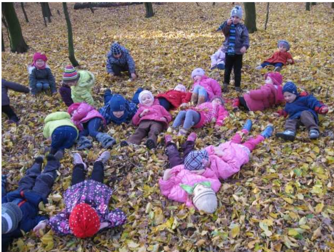
Naprawdę miękki ten leśny dywan ☺.