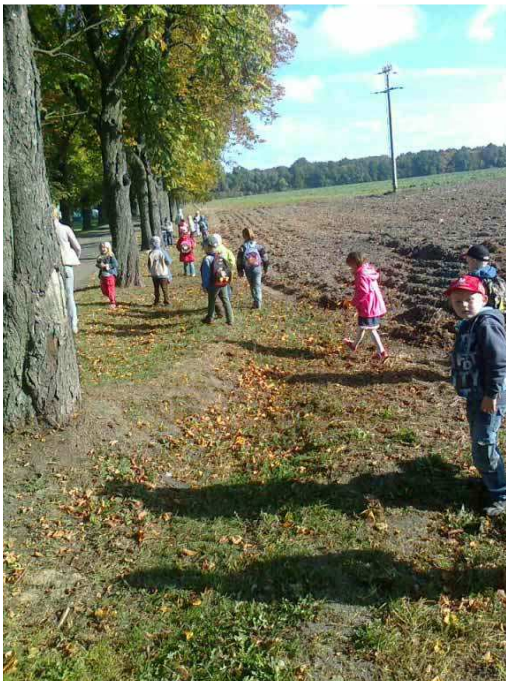
W poszukiwaniu kasztanów.

Piękna pogoda, kolorowe barwy jesieni zachęcają nas do częstych spacerów. Każdego dnia staramy się korzystać z uroków jesieni. Przedszkolaki bardzo chętnie spędzają czas na łonie przyrody. Obserwujemy, jakie zmiany następują w najbliższym otoczeniu, jak zmieniają się kolory liści, poznajemy drzewa i ich owoce w naturalnym środowisku. Grupy starszaków w poszukiwaniu darów jesieni postanowiły wybrać się do pobliskiego parku, aby nazbierać kasztanów.