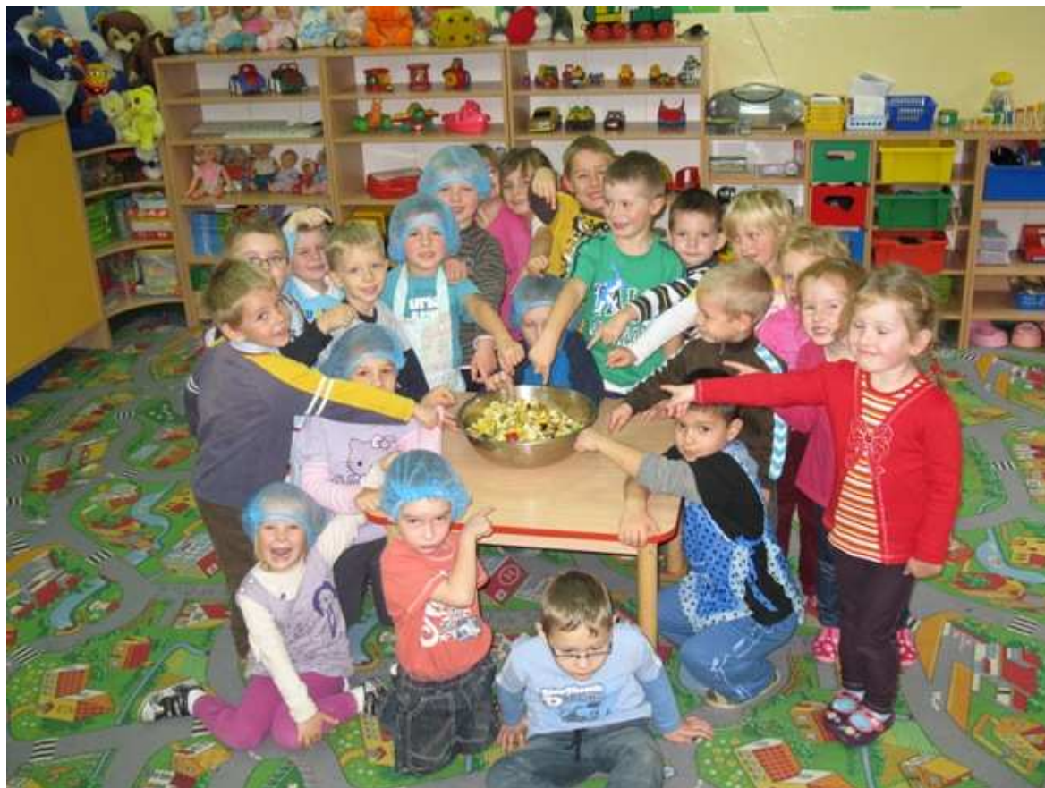
Oto nasze dzieło.