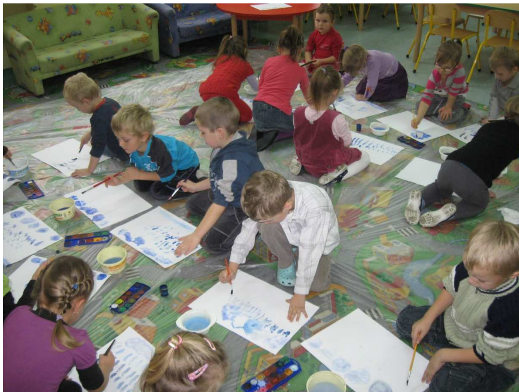
Malujemy mgłę ☺.