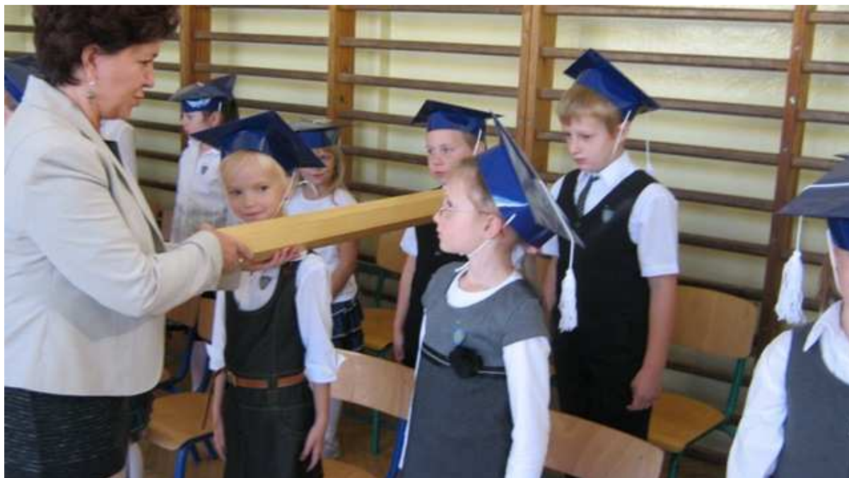
Wychowawczynie wręczyły uczniom legitymacje szkolne, książeczki SKO z symboliczną „złotówką” oraz pamiątkowe dyplomy.