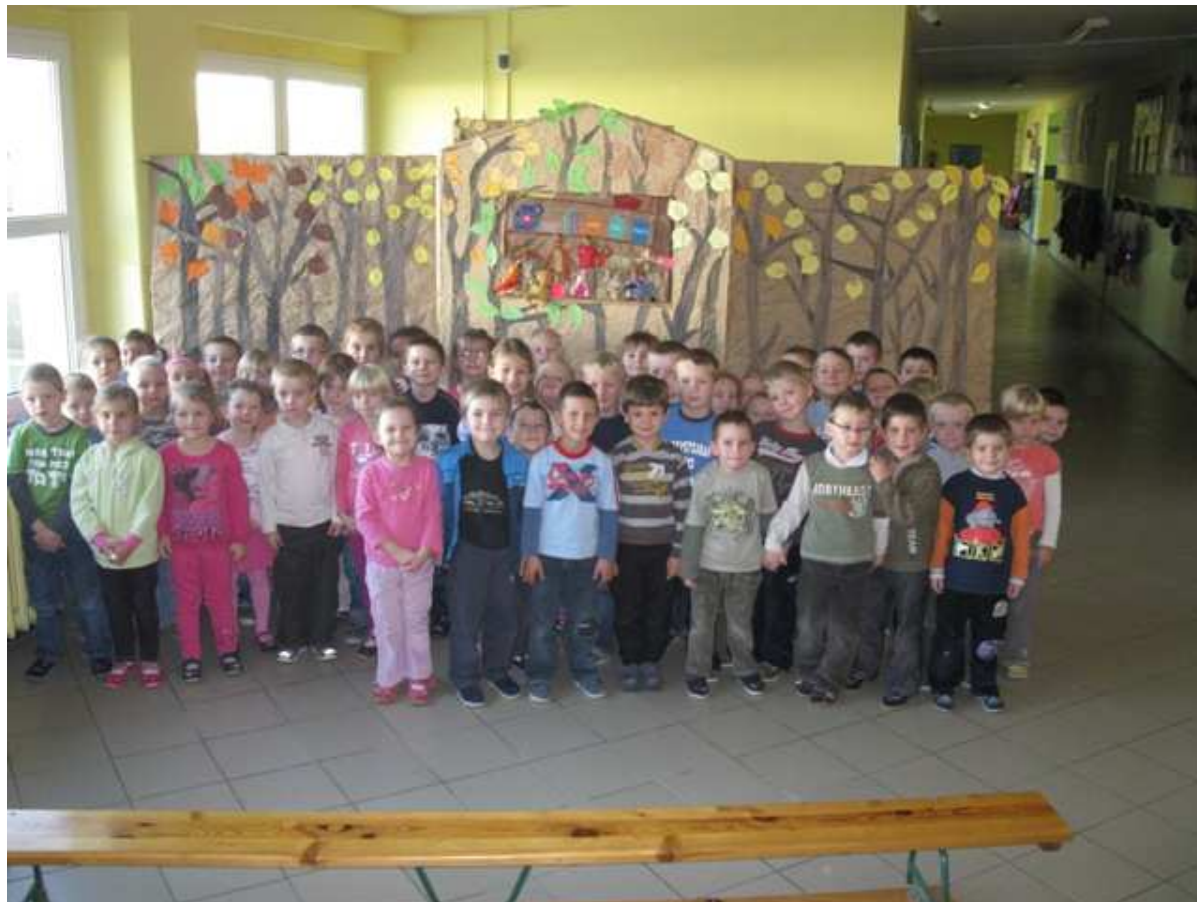
To my - Pszczółki i Biedronki.