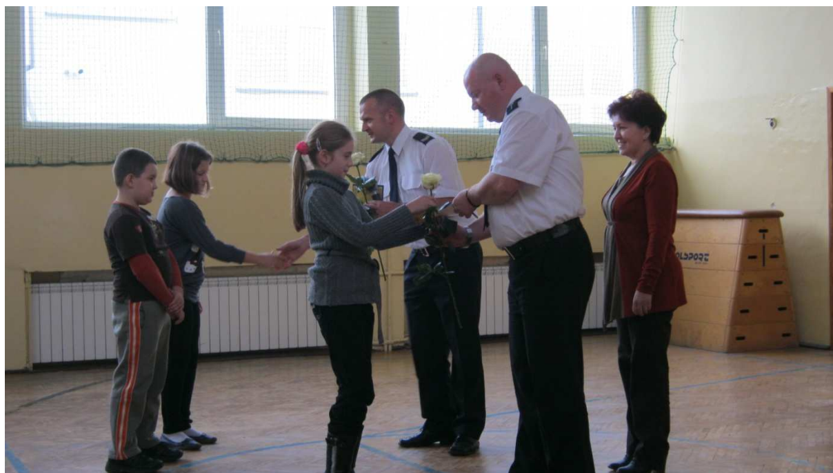
Na zakończenie spotkania policjanci otrzymali od uczniów podziękowania z życzeniami spokojnej pracy.