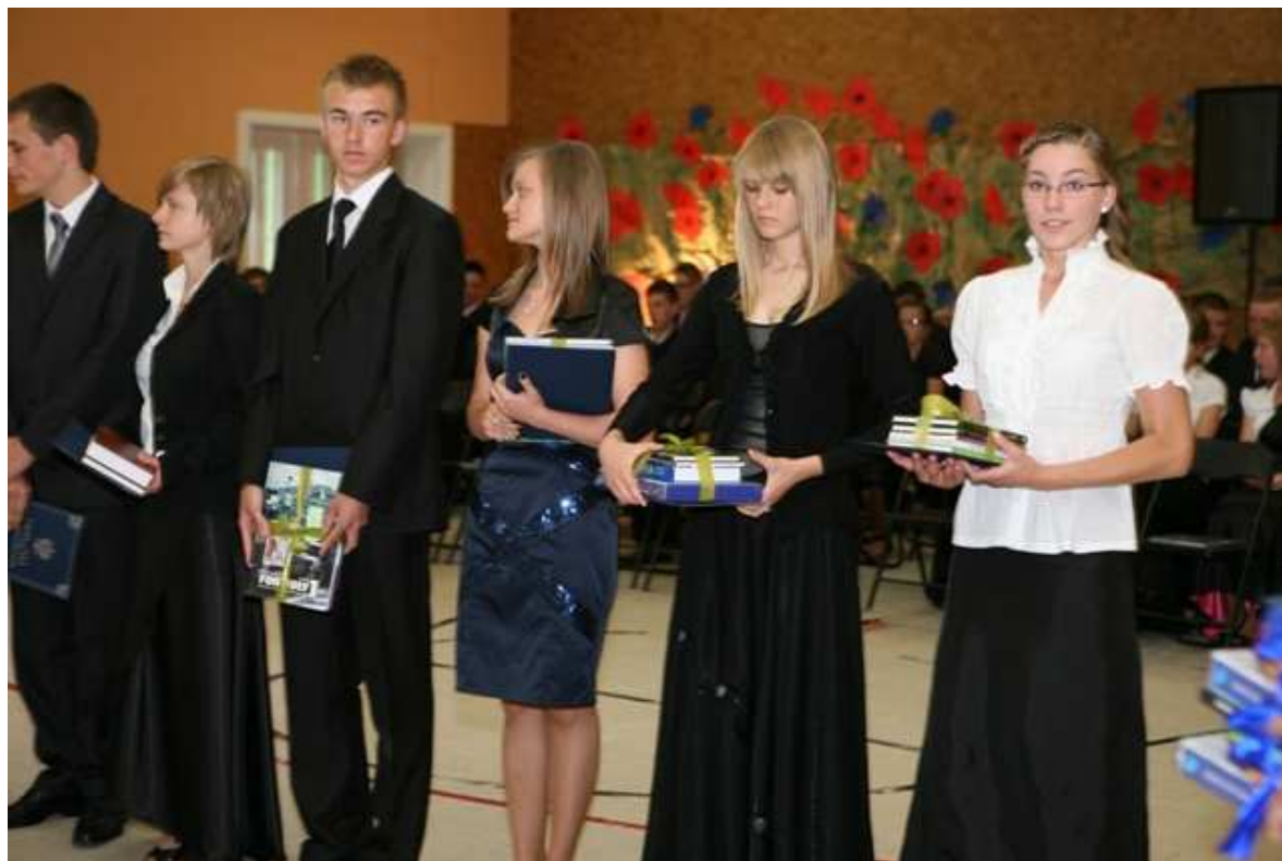
Nagrody za osiągnięcie wysokich wyników w nauce i wzorowe zachowanie.