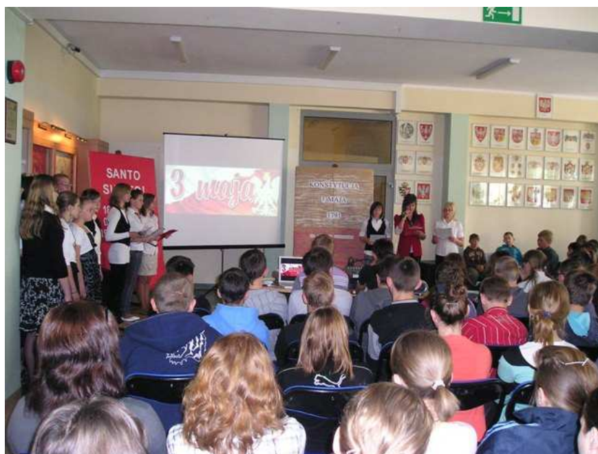
Prezentacja multimedialna dla gimnazjalistów.