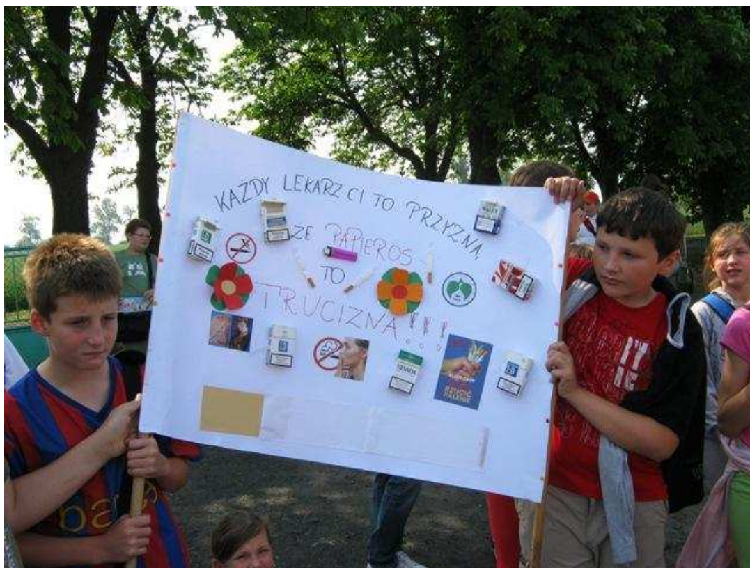
Szkolna akcja plakatowa o charakterze antynikotynowym.

Klasy IV-VI z plakatami antynikotynowymi przemaszerowały na stadion sportowy, by wziąć udział w biegach.