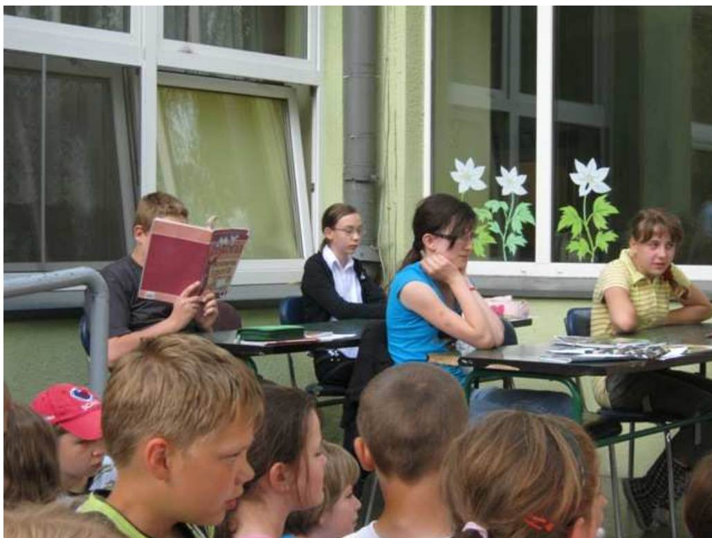
Udział w scenie kabaretowej przygotowanej przez Koło Teatralne ze szkoły podstawowej.