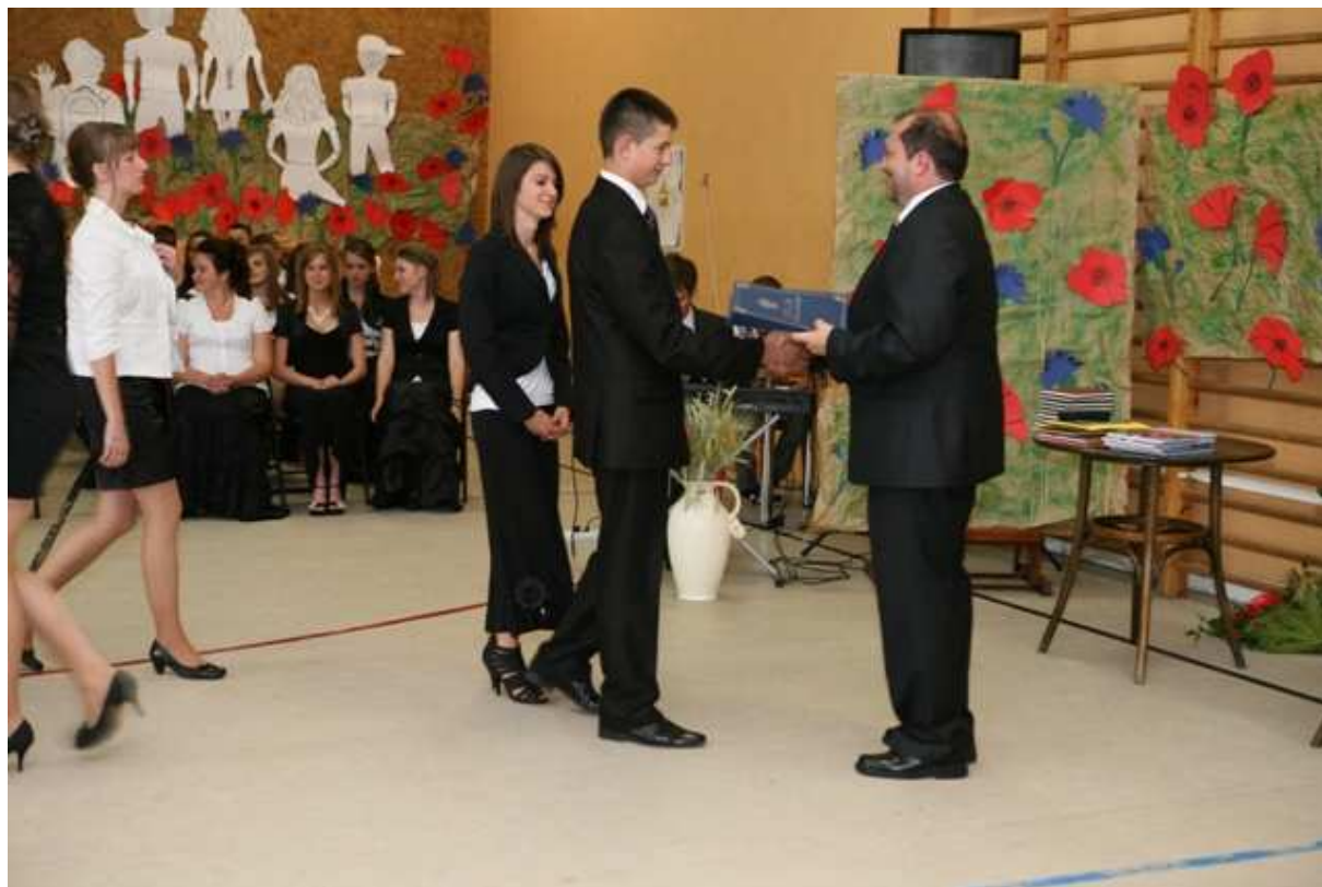
Wręczenie dyplomów ukończenia gimnazjum.