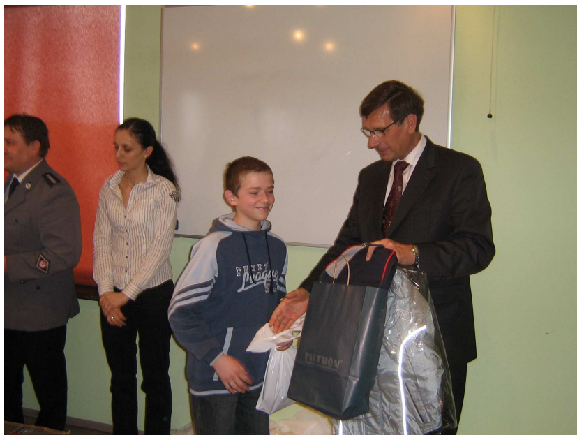
Zespołowo nasza drużyna gimnazjalna zajęła II miejsce.