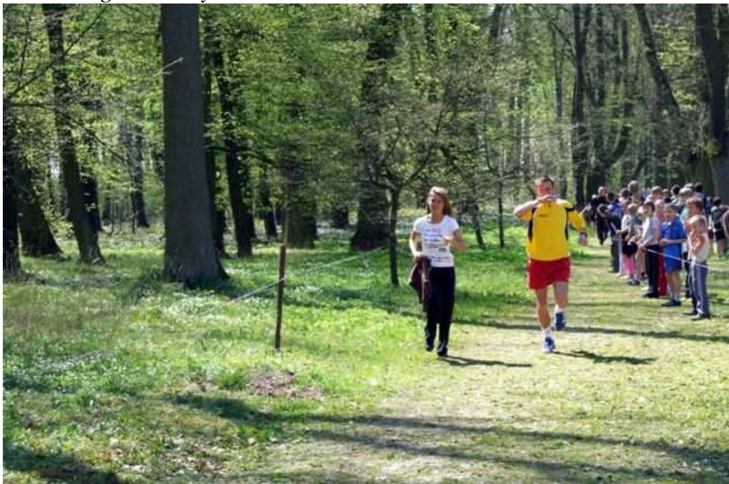
Biegli również nauczyciele wychowania fizycznego.