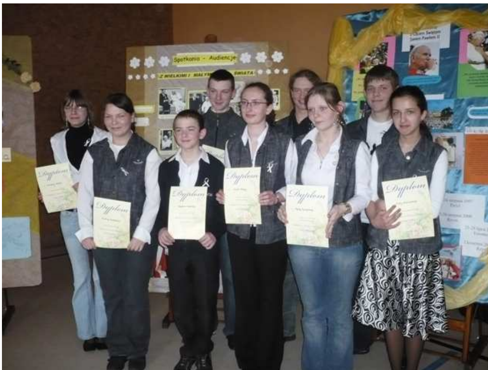
Uczestnicy finału konkursu wiedzy o patronie szkoły.

Środa, 2 kwietnia, w Zespole Szkół Szkoły Podstawowej i Gimnazjum w Pępowie była poświęcona patronowi szkoły- Janowi Pawłowi II.