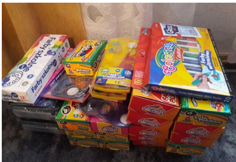
Misjonarka z Japonii w naszej szkole