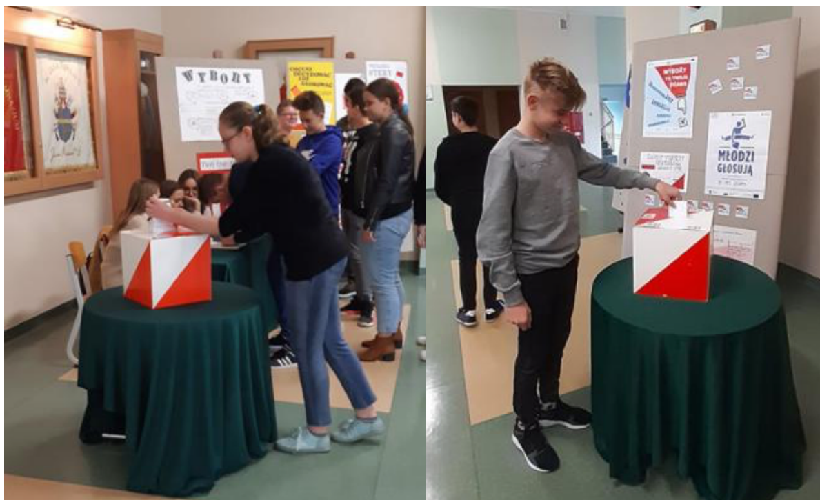
ZJAZD SZKÓŁ IM. JANA PAWŁA II W CZĘSTOCHOWIE