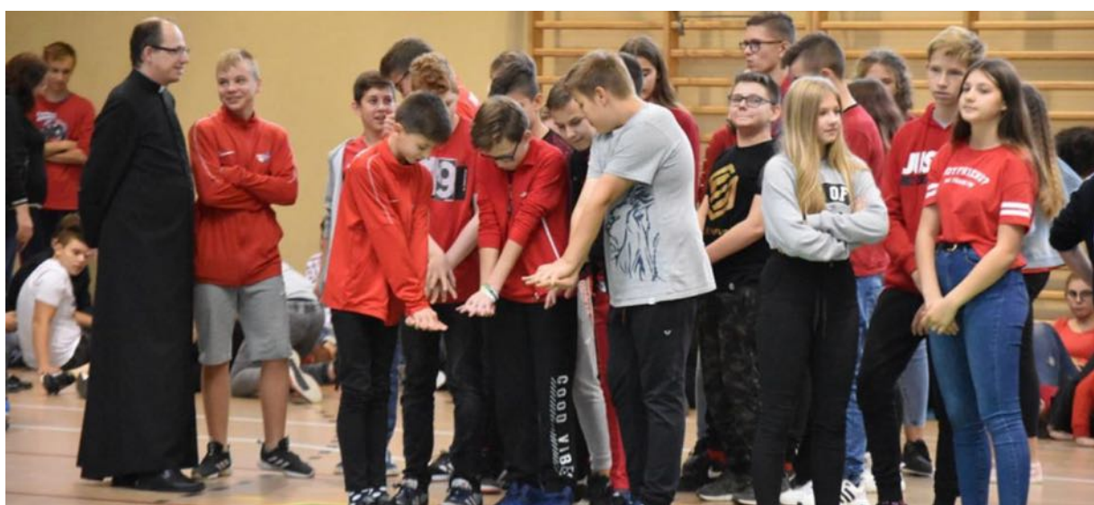
Zbiórka przyborów szkolnych dla dzieci z Ukrainy